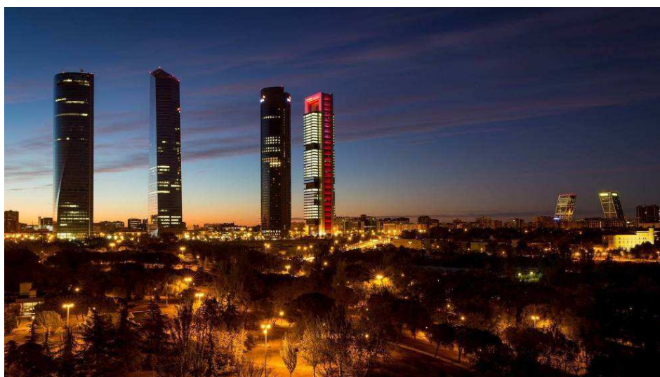
Las torres más altas de la Castellana rasgan el cielo de Madrid

La Gran Logia Masónica, el Cuartel General del Ejército del Aire, la esquina Scweppes o el edificio BBVA serán algunos de los icónicos edificios que abrirán sus puertas al público