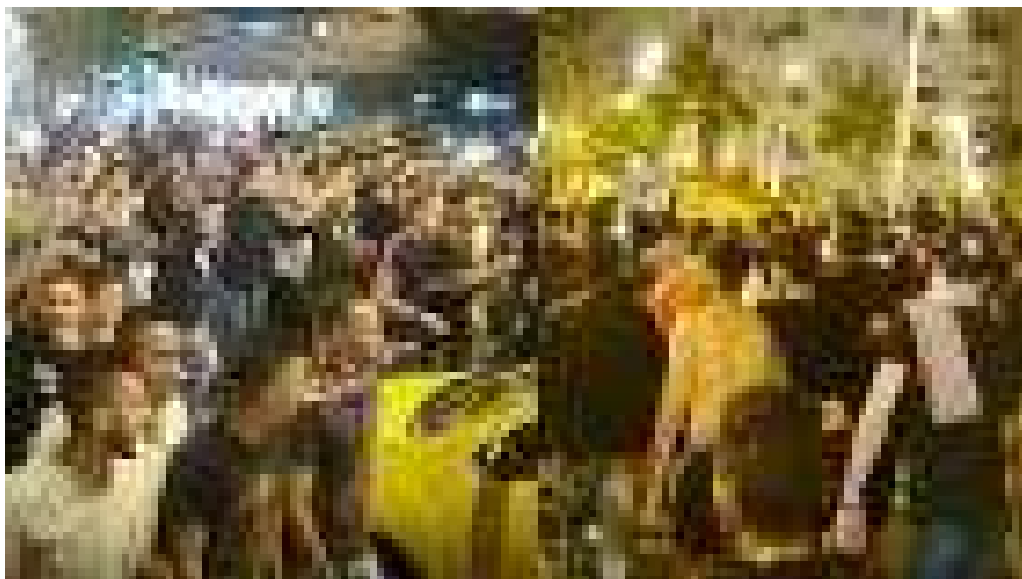
Protesta de jóvenes en Tetuán tras la muerte de una estudiante tiroteada en una patera